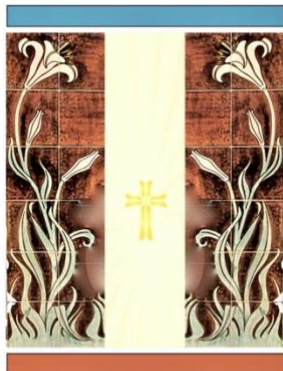
St. Urbanuskerk Nes aan de Amstel